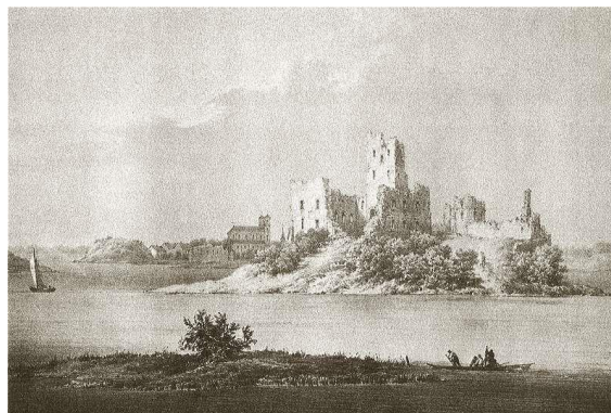
Trakų pilies griuvėsiai XIX amžiuje. Trakų pilies griuvėsiai XIX amžiuje. Piešta Napoleono Ordos