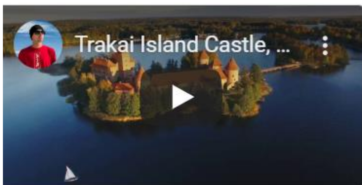
Trakų pilis ir Galvės ežeras iš paukščio skrydžio Pilies vaizdai filmuojant dronu