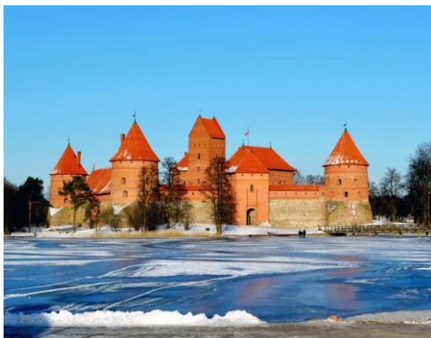
Trakai Castle Trakai Castle

Project Number: 2018-1-PL01-KA201-050865