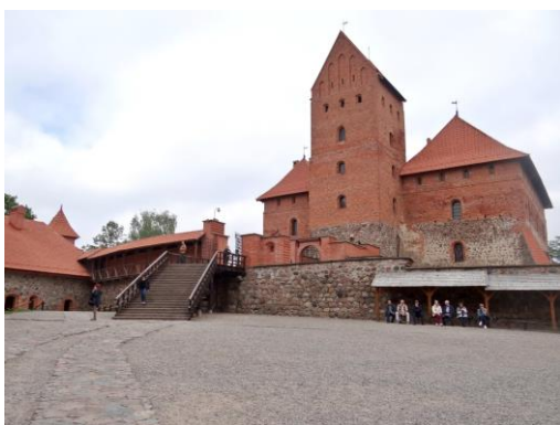
Trakų pilis Trakų pilies vidinis kiemas